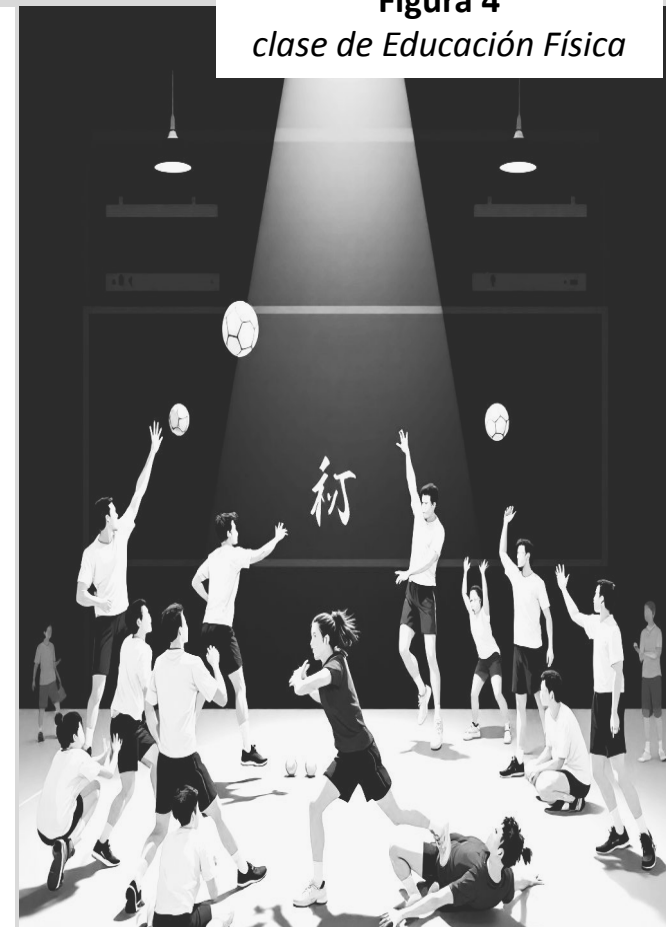
Figura 4 clase de Educación Física

Los intereses estudiantiles también orientan y, a veces, resisten las propuestas, generando tensiones con el currículum oficial y redefiniendo los saberes que se seleccionan o transforman en el aula.