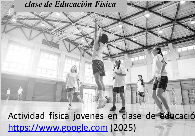
Figura 2 clase de Educación Física

Esta brecha entre lo prescripto y lo enseñado pone de manifiesto la complejidad de la práctica docente, donde las decisiones no son lineales, sino el resultado de un entramado de factores.