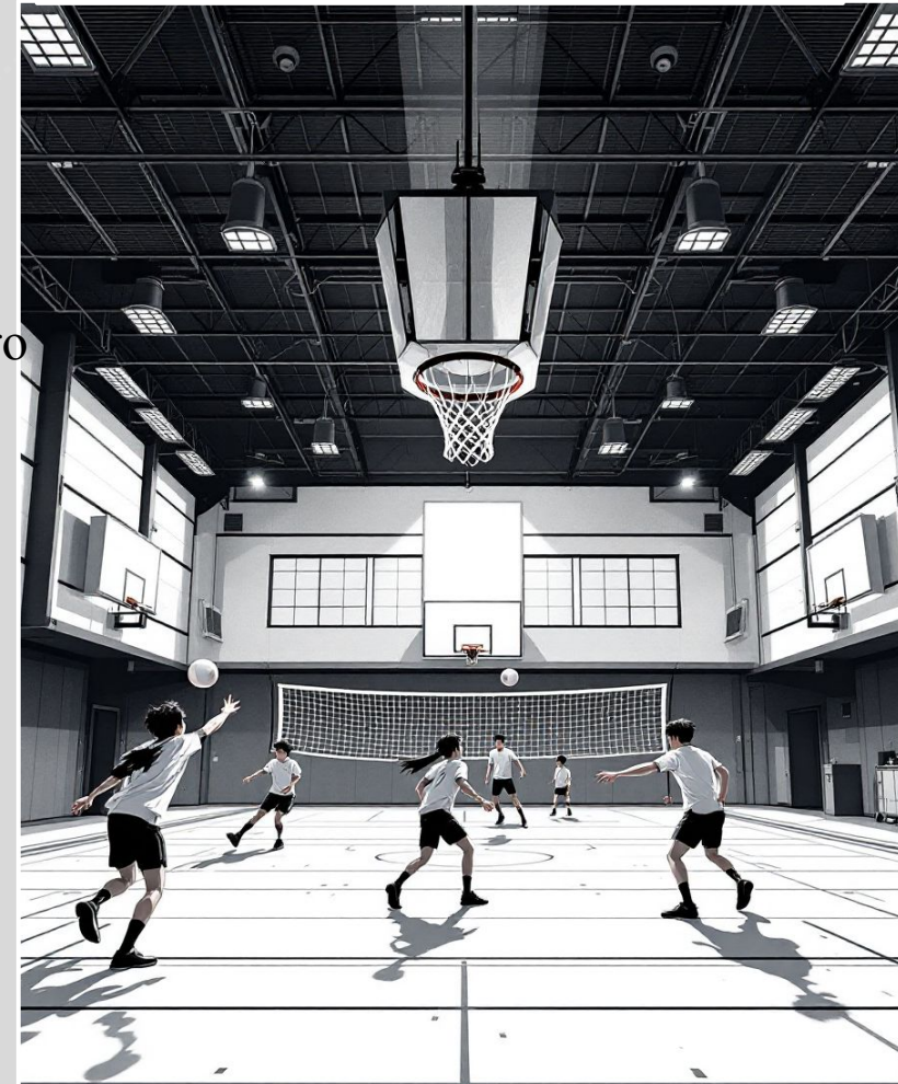
Figura 1 Campo de juego

Jóvenes realizando actividad física en espacio de clase deportiva. https://gamma.app/inspiration (2025)